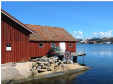
4 Kommuntäckande markanvändning