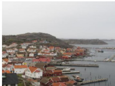
5 Markanvändning, tätorter