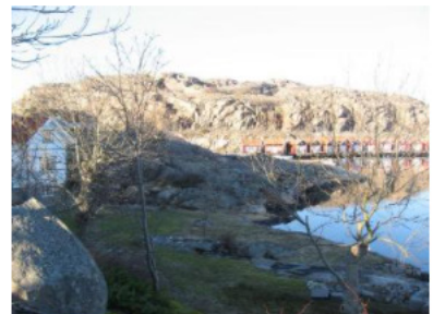
9 Vad tycker du?