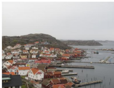
5 Markanvändning, tätorter