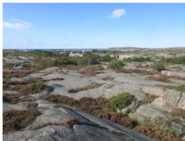
4 Kommuntäckande markanvändning