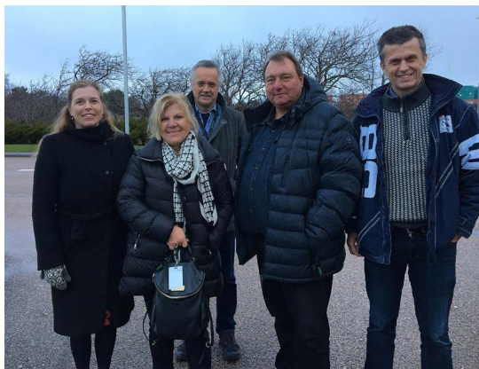
Kommunledningen besökte nyligen Preemraff.

Under ett storstopp september-oktober 2019 kommer en mängd förberedelser att äga rum inför ombyggnationen och då kommer det att befinna sig 2 300 personer på Preemraffs område, utöver den ordinarie personalen. Direkt efter stoppet, kan sedan byggnationen av ROCC-anläggningen påbörjas med 1500 nya man som är på plats under byggtiden. Det blir också 150 nya arbetstillfällen på Preemraff samtidigt som man kommer att ha cirka 200 pensionsavgångar fram till år 2024.