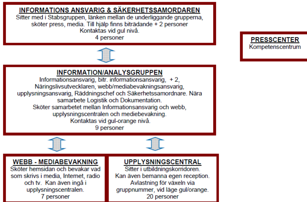
Översikt Stabservice organisation