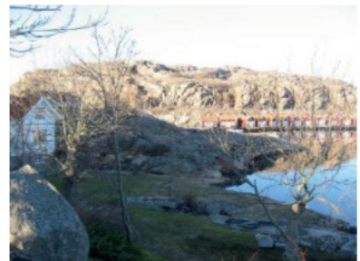
9 Vad tycker du?