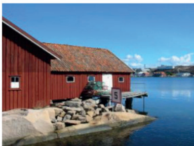
4 Kommuntäckande markanvändning