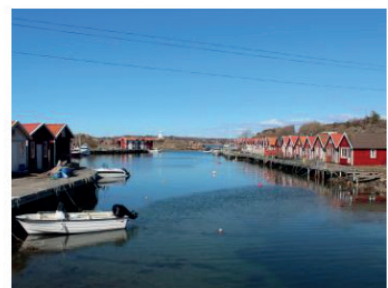
9 Process och utlåtande