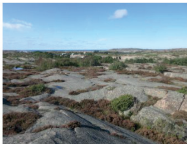
4 Kommuntäckande markanvändning